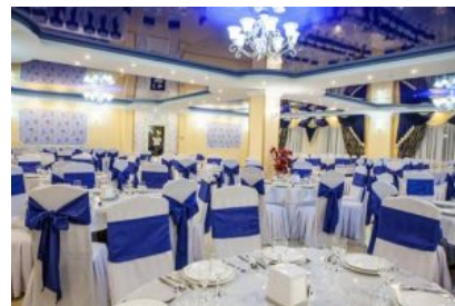
столовая в отеле «Глория»