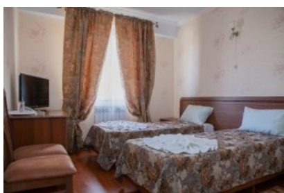
2х местный номер